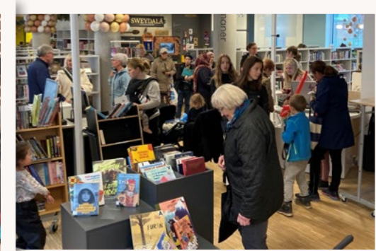
Många var nyfikna på det nya biblioteket.