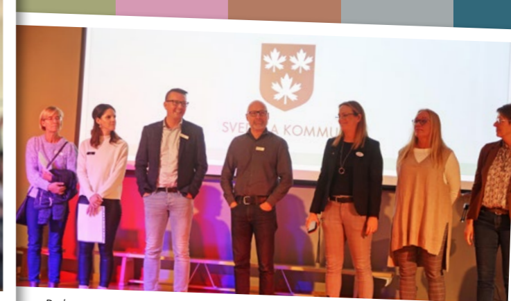
Rektorer och samordnare för verksamhetsförlagd utbildning presenterar vilka lärarstudenter som ska till deras skola.