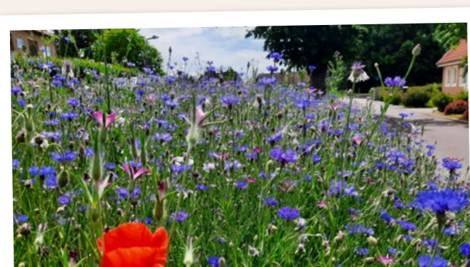
Bilder från Segestrandsängen i Svedala.

På svedala.se/angsytor finns kartor där du kan se vilka ytor som sås. Målet är att skapa artrika ängar som ska bidra till den biologiska mångfalden. Dessutom vill vi skapa vackra blommande ytor av tidigare ytor med höggräs eller klippt gräs.