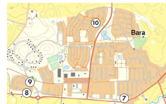
Bakgrundskartan är från Lantmäteriet.