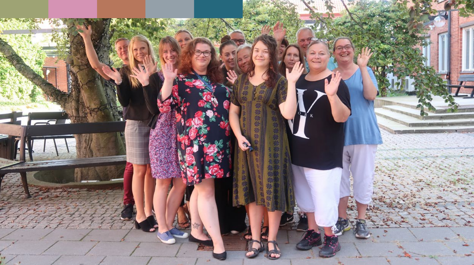
Vi på Bygg och miljö med kollegor.