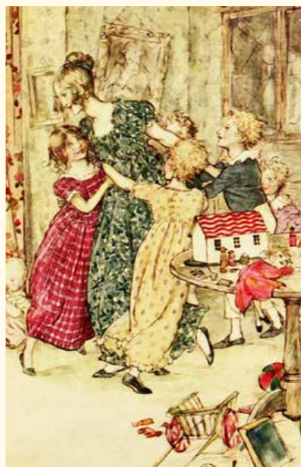
Charles Dickens och det viktorianska julfirandet.