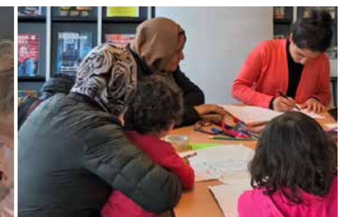
Lektion i datorkunskap.