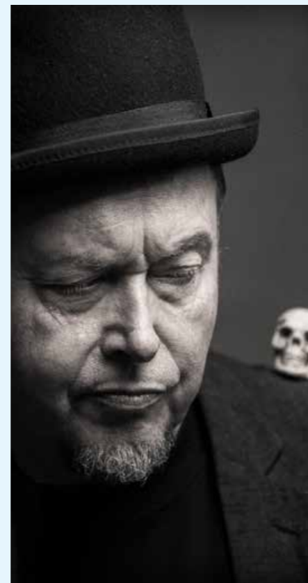
Möte med magikern.

Kom till biblioteket och pyssla trollstavar, enhörningar och annat magiskt.