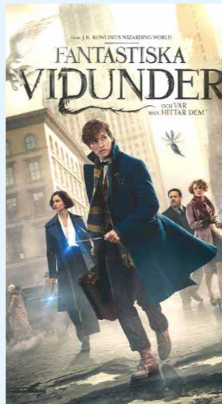
Filmvisning Fantastiska vidunder.

Kom till biblioteket och pyssla trollstavar, enhörningar och annat magiskt.