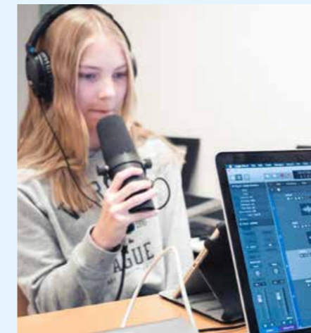
Skapa din egen musik (Foto: Kristoffer Heidenborg).

Bara Basket bjuder in till en prova-på-aktivitet där du kan pröva på kung-fu, parkour och basket. För dig 6–15 år.