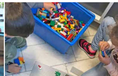
Deltagare på träffpunkten Svedala Tillsammans.