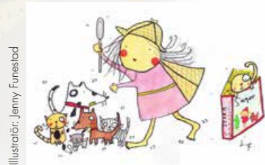
Illustrator: Jenny Funesjö

FAMILJLÖRDAG BARA BIBLIOTEK – 7/4 kl 10–13.