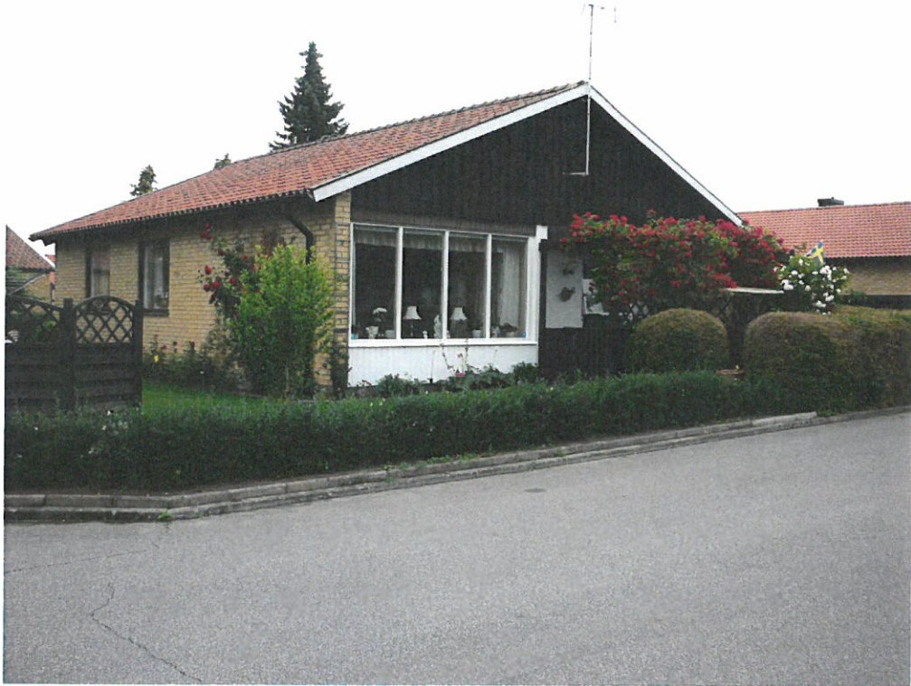
Gulteglät grupphus med gavelspets i trä samt med inbjudande häck mot gaturummet