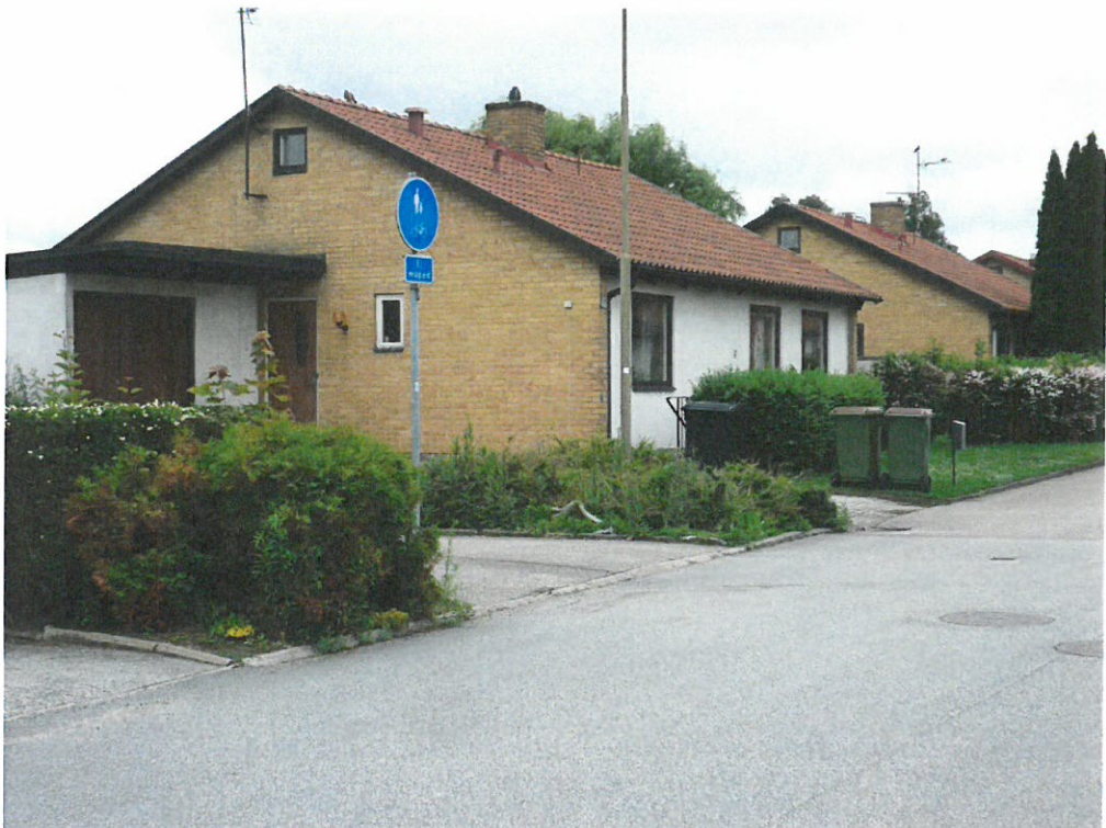
Gruppvis med fasader i gult tegel och vitmålade betongelement samt med rött taktegel och skorsten i tegel