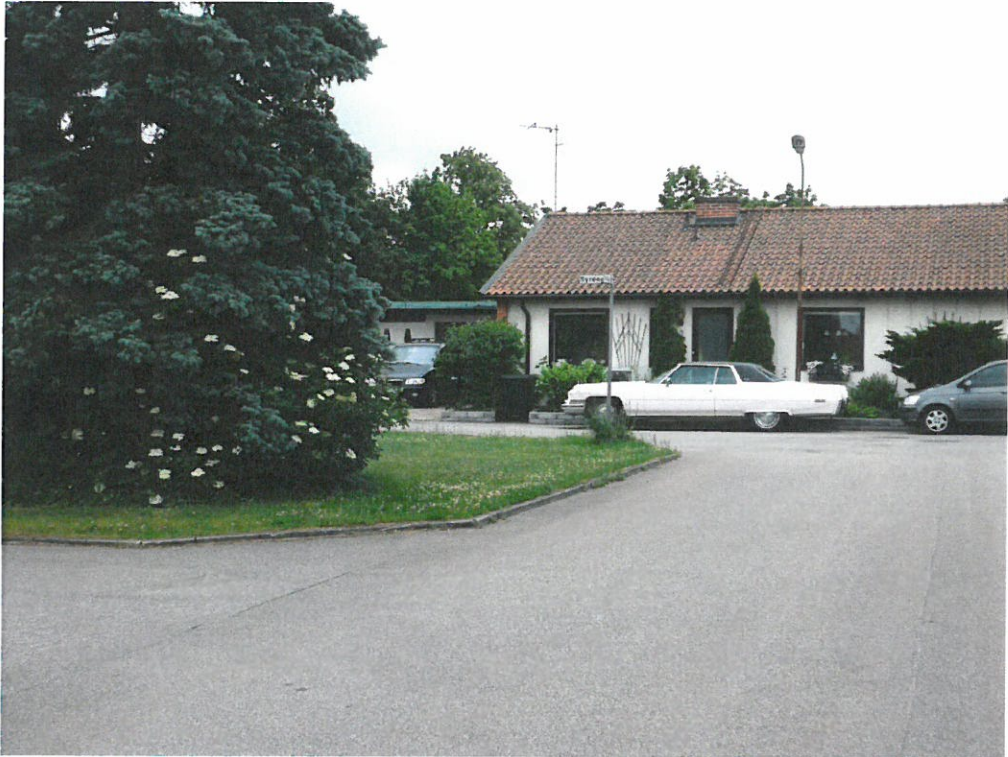
Området är grönt och lummigt med små gröna platser