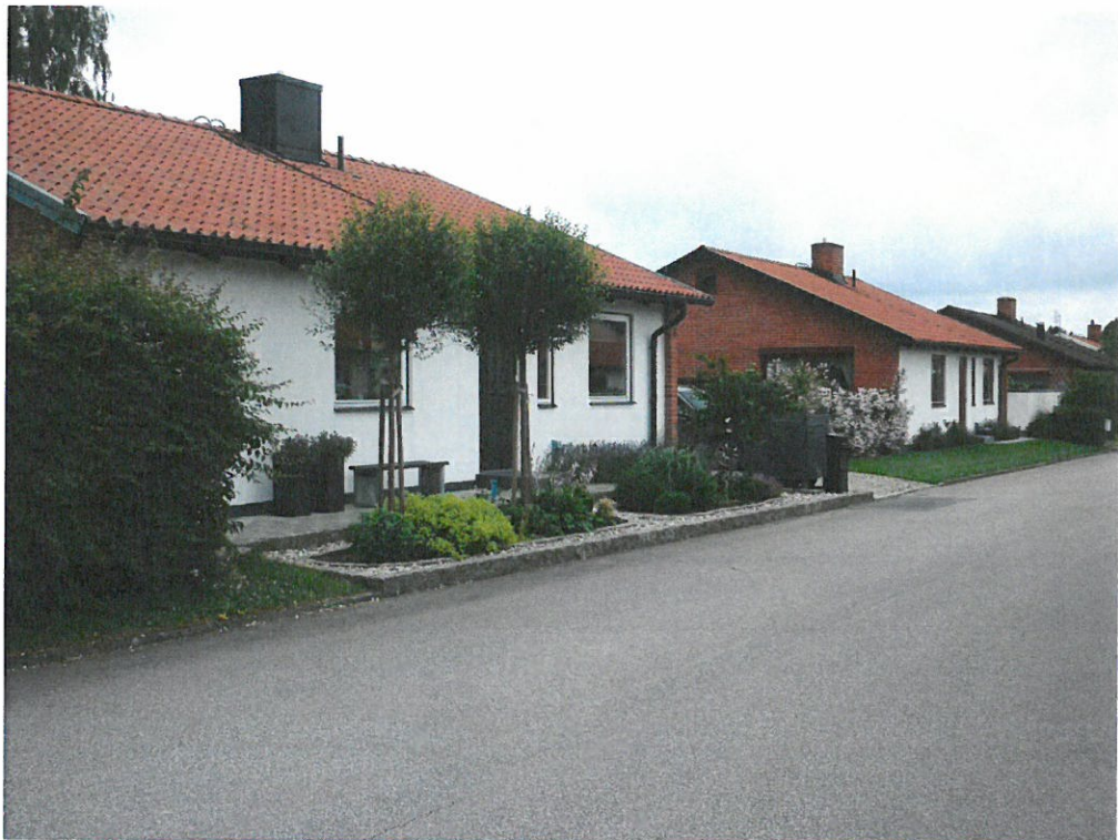
Vy från området