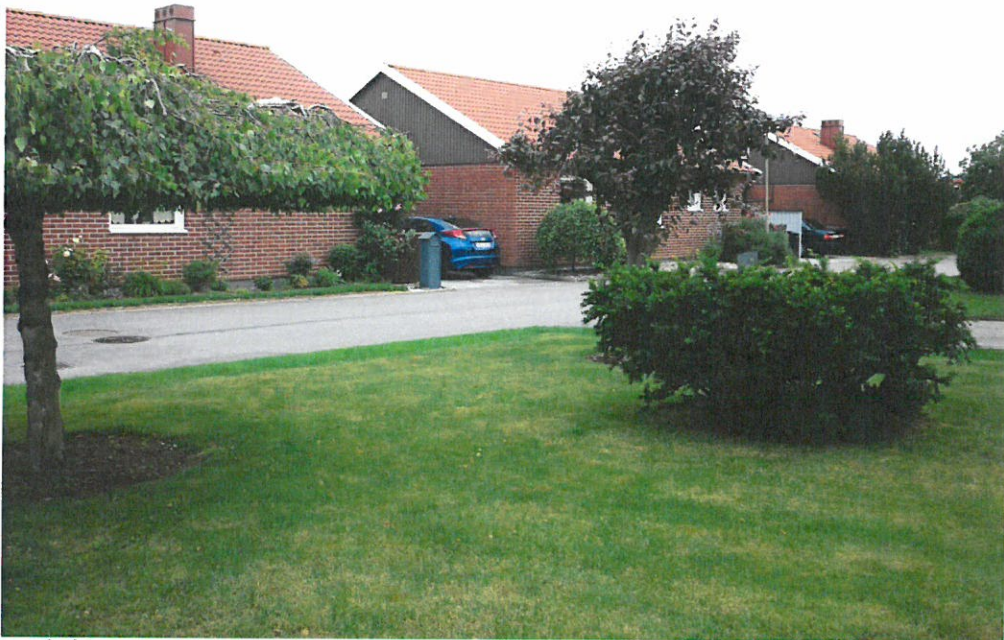
Kedjehus utmed Lönngatan

Åtgärden (materialbyte och byte av kulör) kräver ibland lov och ibland inte. Se utdrag ur plan- och bygglagen nedan. Bakgrunden är att bebyggelse samverkar i upplevelsen av ett bostadsområde där varje byggnad är en del av helheten. Omgivningen ska vara vägledande vid omfärgning eller materialbyte, vilket innebär att skälig hänsyn ska tas inom dessa grupper för att bevara harmoni och god helhetsverkan. Jämför plan- och bygglagen (2010:900) 2 kap. 6 § punkt 1 nedan.