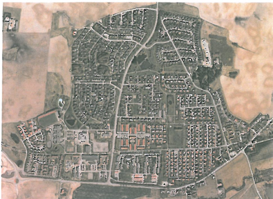
ORTOFOTO - BARA