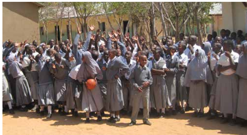
Vänskolan i Tanzania.

PÅSKLÄSNING Vi läser in påsken med mysiga berättelser. Ingen föransmälan. Bara bibliotek: tisdag 11 april kl 10, 3-6 år. Klågerup bibliotek: tisdag 11 april kl 16, 3-6 år.